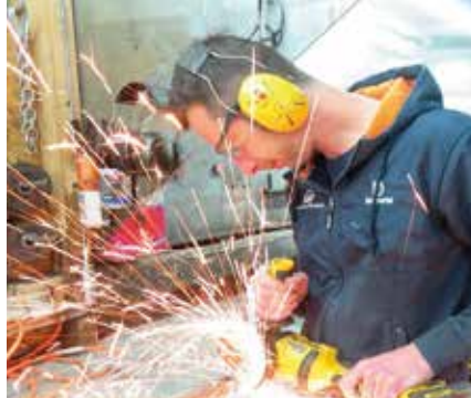
Werkstatt | Reparatur